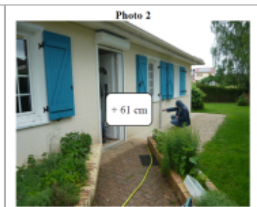
Trace du maximum de la crue sur la façade du 4 rue George Brassens