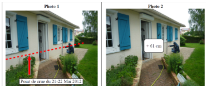
Trace du maximum de la crue sur la façade du 4 rue George Brassens

Altitude calculée de l'eau (en m) : 226.96