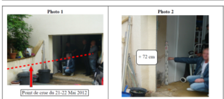
Trace du maximum de la crue dans le garage du 12 rue du Chamoine Rollin

GÉNÉRAL Code : WEB_R_201810180624 Date de mise à jour : 20/11/2018 Auteur : DDT54_PR-GC_MH