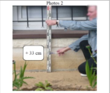
Trace du maximum de la crue sur la façade de la maison

SOURCE DE REPÉRAGE : DDT 54 (MAI 2012) - 22/05/2012 Type de repérage : Campagne de terrain post-inondation