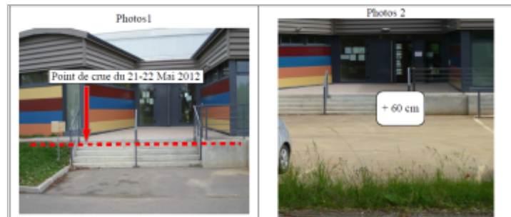
Escalier d'accès à la Maison Médicale