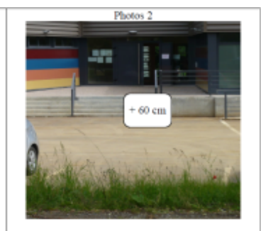
Escalier d'accès à la Maison Médicale

MARQUE Texte : Maison Médicale Maximum de l'inondation : Oui