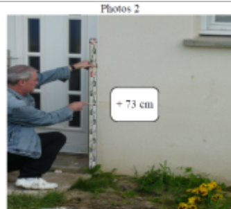
Trace sur la façade du 48 Bis rue de Metz

SOURCE DE REPÉRAGE : DDT 54 (MAI 2012) - 22/05/2012