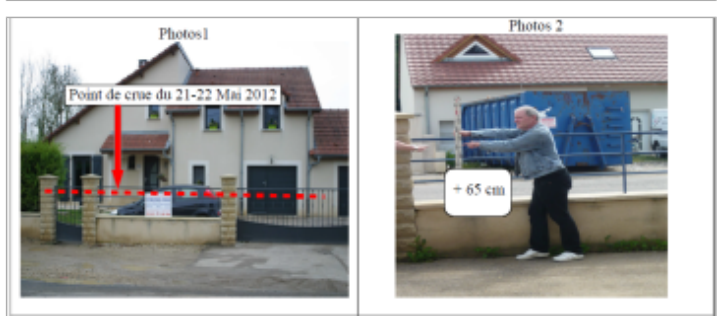
Trace du maximum de la crue sur le portail du 45 rue de Metz

GÉNÉRAL Code : WEB_R_201810182550 Date de mise à jour : 09/11/2018 Auteur : DDT54_PR-GC_MH