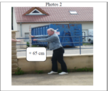
Trace du maximum de la crue sur le portail du 45 rue de Metz

MARQUE Texte : 45 rue de Metz Maximum de l'inondation : Oui