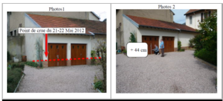
Porte de garage au 3 rue de l'étang

MARQUE Texte : 3 rue de l'étang Maximum de l'inondation : Oui