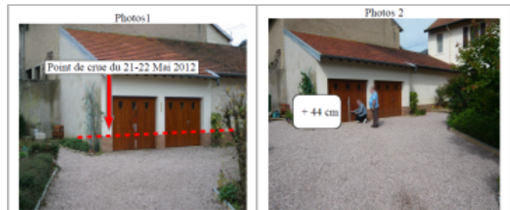
Porte de garage au 3 rue de l'étang