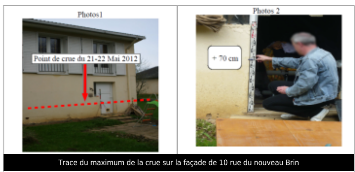
Trace du maximum de la crue sur la façade de 10 rue du nouveau Brin

MARQUE Texte : 10 rue du nouveau Brin Maximum de l'inondation : Oui