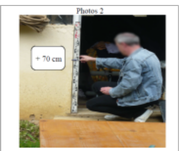
Trace du maximum de la crue sur la façade de 10 rue du nouveau Brin

MARQUE --- Texte : 10 rue du nouveau Brin Maximum de l'inondation : Oui