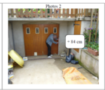
Trace du maximum de la crue sur la porte du garage du 9 rue du nouveau Brin

MARQUE ----- Texte : 9 rue du nouveau Brin Maximum de l'inondation : Oui