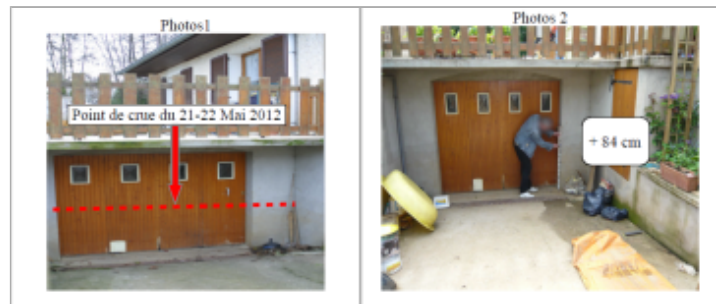
Trace du maximum de la crue sur la porte du garage du 9 rue du nouveau Brin