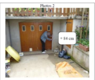
Trace du maximum de la crue sur la porte du garage du 9 rue du nouveau Brin

MARQUE ----- Texte : 9 rue du nouveau Brin Maximum de l'inondation : Oui