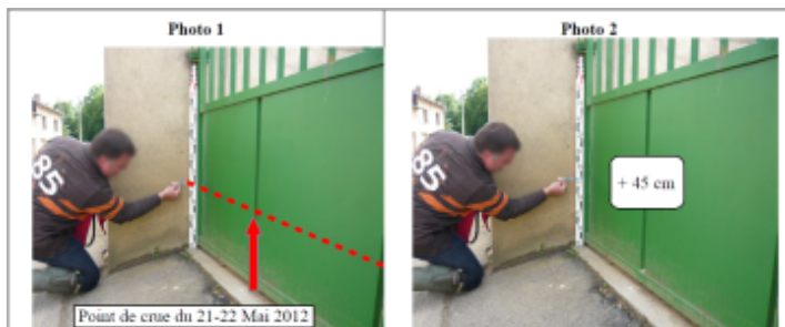
Trace sur la portail

Altitude calculée de l'eau (en m) : 222.85