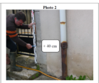
Trace sur la façade

MARQUE Texte : 1 rue Jean Mermoz Bis Maximum de l'inondation : Oui