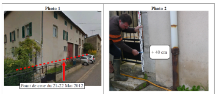
Point de crue du 21-22 Mai 2012 Trace sur la façade

MARQUE Texte : 1 rue Jean Mermoz Bis Maximum de l'inondation : Oui