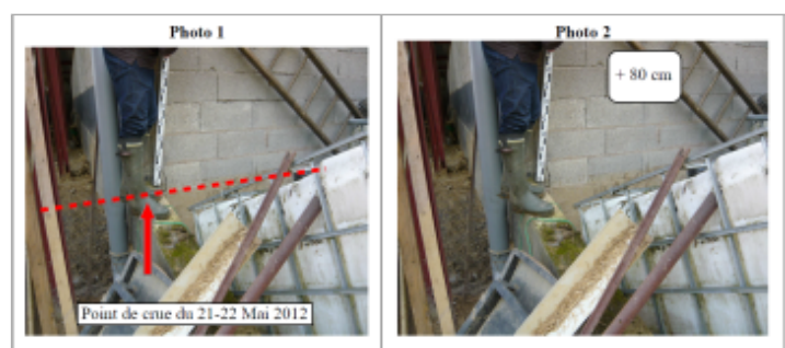
Trace sur le mur agglo

GÉNÉRAL Code : WEB_R_201810175614 Date de mise à jour : Auteur : DDT54_PR-GC_MH 08/11/2018