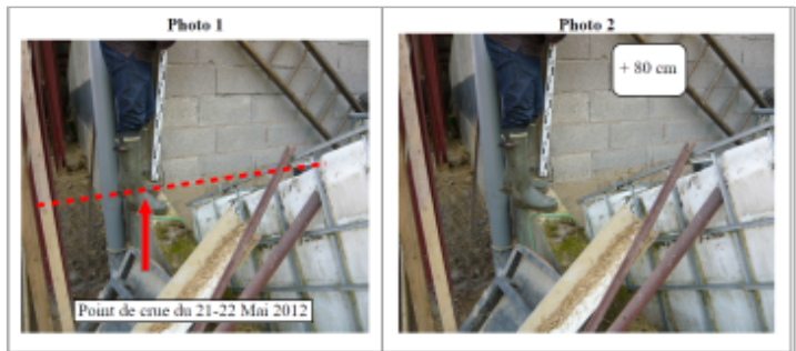
Trace sur le mur agglo

GÉNÉRAL Code : WEB_R_201810175614 Date de mise à jour : Auteur : DDT54_PR-GC_MH 08/11/2018