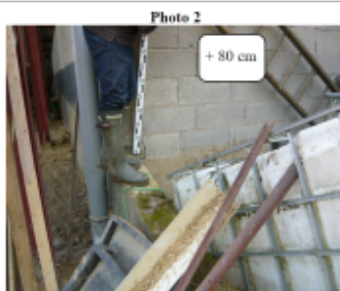
Trace sur le mur aggro