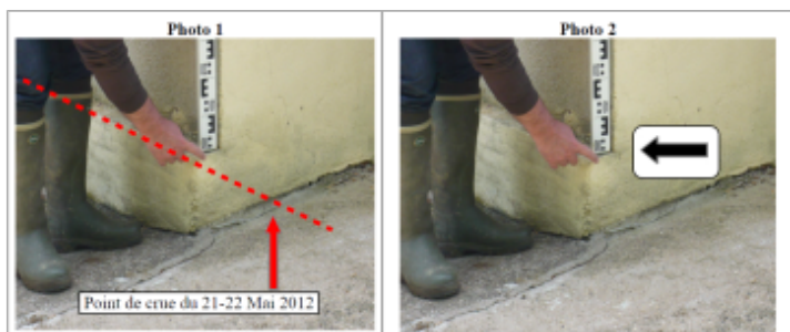
Trace au coin du mur

Texte : 1 rue Jean Mermoz Maximum de l'inondation : Oui