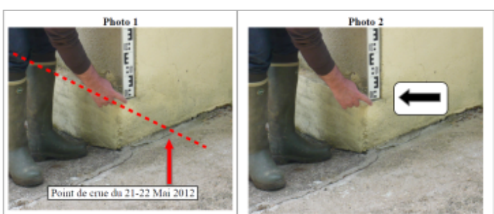
Trace au coin du mur

GÉNÉRAL --- Code : WEB_R_201810174705 Date de mise à jour : 08/11/2018 Auteur : DDT54_PR-GC_MH