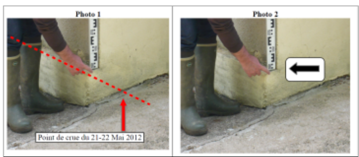
Trace au coin du mur

GÉNÉRAL Code : WEB_R_201810174705 Date de mise à jour : Auteur : DDT54_PR-GC_MH 08/11/2018