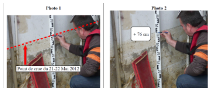
Trace sur le mur à l'intérieur de la maison