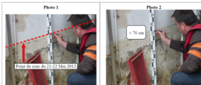
Trace sur le mur à l'intérieur de la maison

Référence nivelée : Marque d'inondation Système altimétrique : NGF IGN 1969 (système normal) Altitude de la référence (en m) : 220.680 m Altitude calculée de l'eau (en m) : 220.68