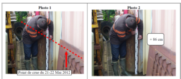
Trace sur le mur et la porte

GÉNÉRAL Code : WEB_R_201810172334 Date de mise à jour : 08/11/2018 Auteur : DDT54_PR-GC_MH