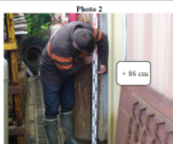
Trace sur le mur et la porte