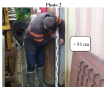
Trace sur le mur et la porte