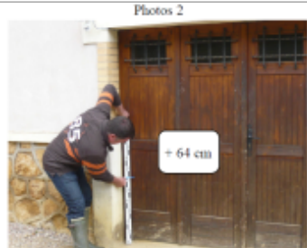
Trace du maximum de la crue sur la porte de garage du 16 rue D'Eulmont