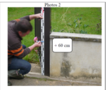
Trace du maximum de la crue sur le muret de clôture du 12 rue D'Elmont

SOURCE DE REPÉRAGE : DDT 54 (MAI 2012) - 22/05/2012 Type de repérage : Campagne de terrain post-inondation