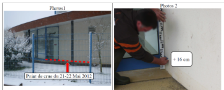
Trace du maximum de la crue sur la façade de la salle des fetes

SOURCE DE REPÉRAGE : DDT 54 (MAI 2012) - 22/05/2012