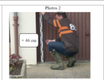
Trace du maimum de la crue sur la porte de garage du 31 rue D 'EULMONT

MARQUE Texte : 31 rue D'EULMONT Maximum de l'inondation : Oui