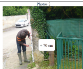
Trace du maximum de la crue sur le mur de clôture au 7 rue de la Gare

SOURCE DE REPÉRAGE : DDT 54 (MAI 2012) - 22/05/2012