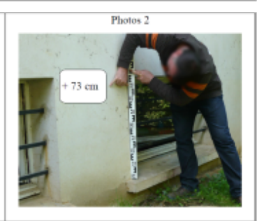
Trace du maximum de la crue sur la façade du 9 rue de Nancy

SOURCE DE REPÉRAGE : DDT 54 (MAI 2012) - 22/05/2012 Type de repérage : Campagne de terrain post-inondation