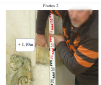
Trace du maximum de la crue sur la façade du 8 rue de Nancy

MARQUE Texte : 8 rue de Nancy Maximum de l'inondation : Oui