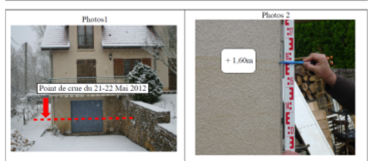
Trace du maximum de la crue sur la façade au niveau du garage du 7 rue de Nancy

GÉNÉRAL Code : WEB_R_201810171808 Date de mise à jour : 13/11/2018 Auteur : DDT54_PR-GC_MH