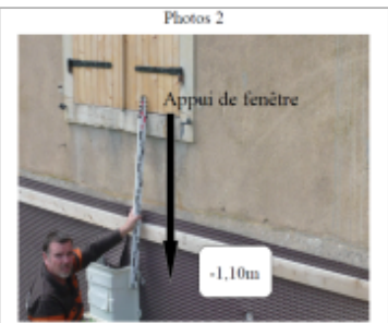
Trace du maximum de la crue sur le sous bassement de la maison du 32 rte de Bouxieres

SOURCE DE REPÉRAGE : DDT 54 (MAI 2012) - 22/05/2012 Type de repérage : Campagne de terrain post-inondation