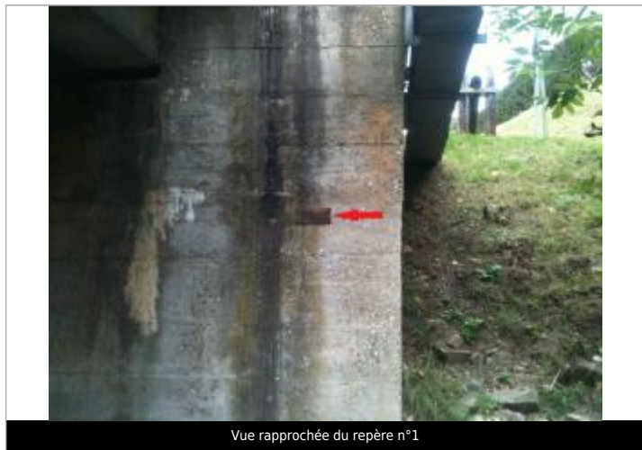
Vue rapprochée du repère n°1

Texte : Hautes eaux 1983 Maximum de l'inondation : Oui Visibilité : Oui