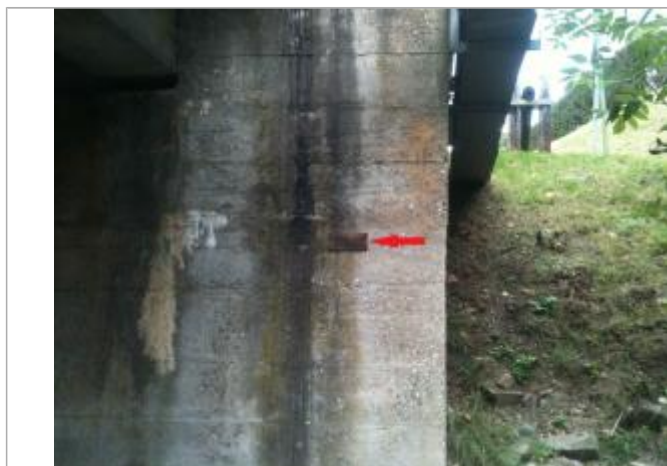
Vue rapprochée du repère n°1