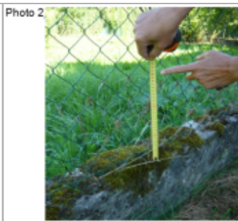
Trace du maximum de la crue sur le grillage au dessus du muret de clôture du 53 Grande Rue

SOURCE DE REPÉRAGE : DDT 54 (JUN 2016) - 15/06/2016