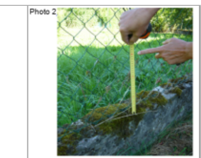
Trace du maximum de la crue sur le grillage au dessus du muret de clôture de 53 Grande Rue

MARQUE Texte : 53 Grande Maximum de l'inondation : Oui