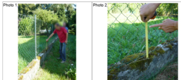
Trace du maximum de la crue sur le grillage au dessus du muret de clôture du 53 Grande Rue