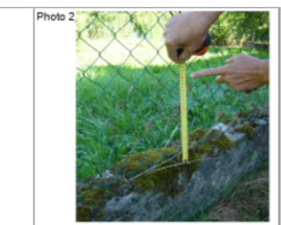
Trace du maximum de la crue sur le grillage au dessus du muret de clôture de 53 Grande Rue

MARQUE Texte : 53 Grande Maximum de l'inondation : Oui