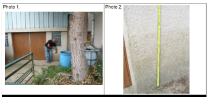
Trace du maximum de la crue sur la façade à côté du garage sur la maison au croisement rte de Nancy et rue des Charmilles

MARQUE Texte : croisement Rte de Nancy et rue des Charmilles Maximum de l'inondation : Oui