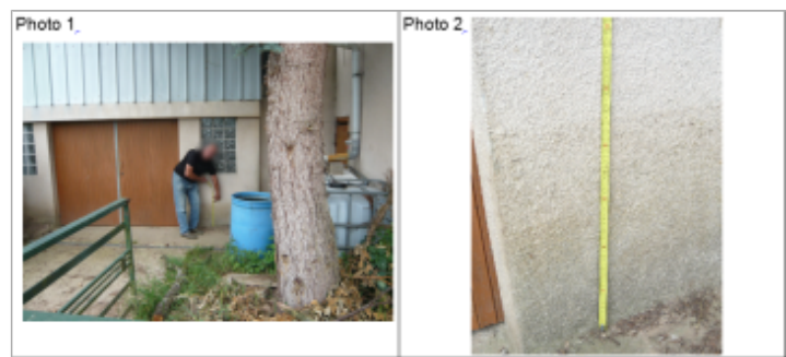
Trace du maximum de la crue sur la façade à côté du garage sur la maison au croisement rte de Nancy et rue des Charmilles

MARQUE Texte : croisement Rte de Nancy et rue des Charmilles Maximum de l'inondation : Oui