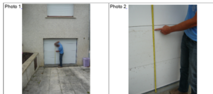
Trace du maximum sur la porte de garage du 10 rue du Château