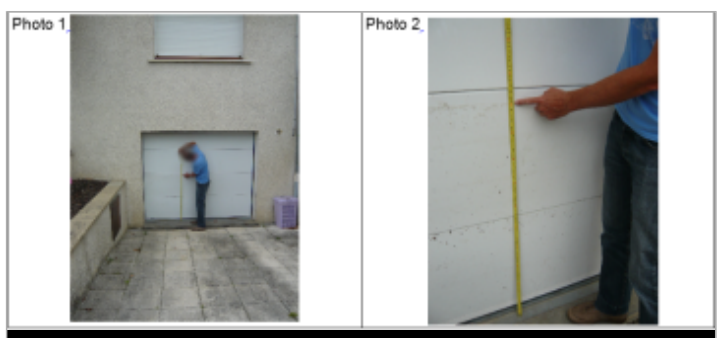
Trace du maximum sur la porte de garage du 10 rue du Château

GÉNÉRAL --- Code : WEB_R_201810161734 Date de mise à jour : 04/12/2018 Auteur : DDT54_PR-GC_MH