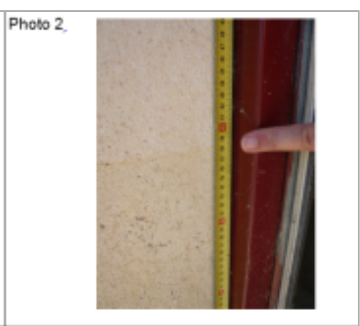
Trace du maximum de la crue sur la façade du 56 rue de la Gare

MARQUE Texte : 56 rue de la Gare Chambley Bussières bis Maximum de l'inondation : Oui