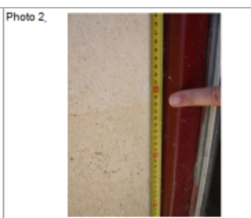
Trace du maximum de la crue sur la façade du 56 rue de la Gare

MARQUE Texte : 56 rue de la Gare Chambley Bussières bis Maximum de l'inondation : Oui