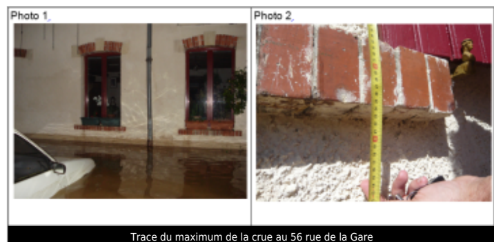
Trace du maximum de la crue au 56 rue de la Gare