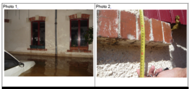
Trace du maximum de la crue au 56 rue de la Gare

MARQUE Texte : 56 rue de la Gare Maximum de l'inondation : Oui