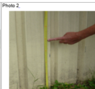
Trace sur le bardage du hangar