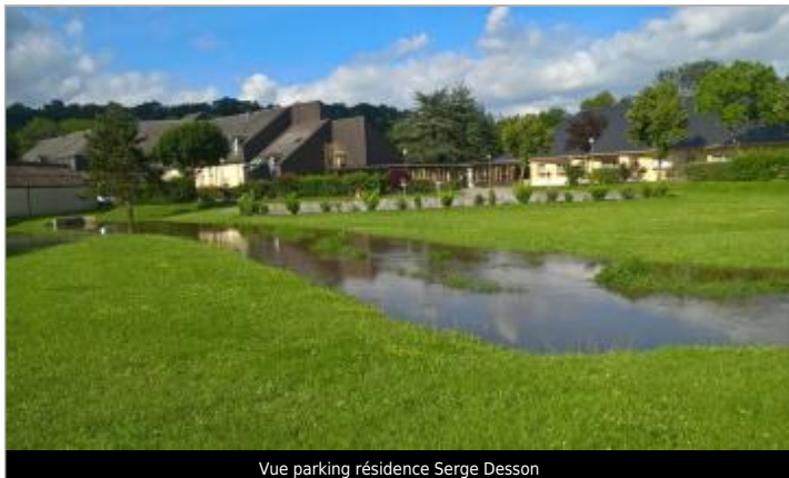
Vue parking résidence Serge Desson