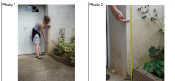
trace du maximum de la crue sur la façade à coté de la porte d'entrée du 2 rte de Serre

Texte : 2 rte de serre commune de Valhey Maximum de l'inondation : Oui