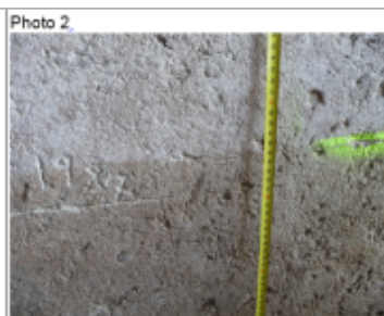
trace du maximum de la crue sur le crépis ciment au 6 place de l'église

SOURCE DE REPÉRAGE : DDT 54 (JUN 2016) - 15/06/2016