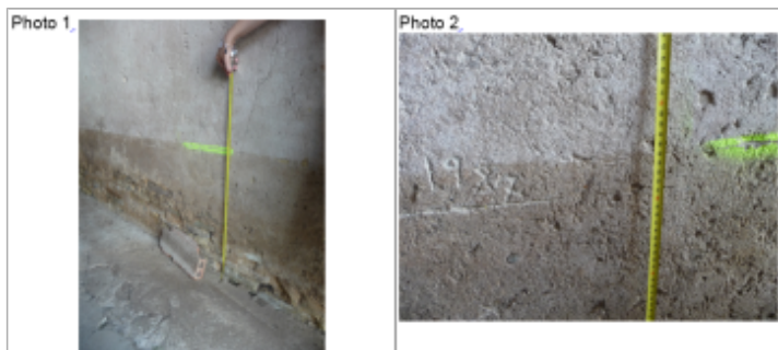
trace du maximum de la crue sur le crépis ciment au 6 place de l'église

Altitude calculée de l'eau (en m) : 240.07