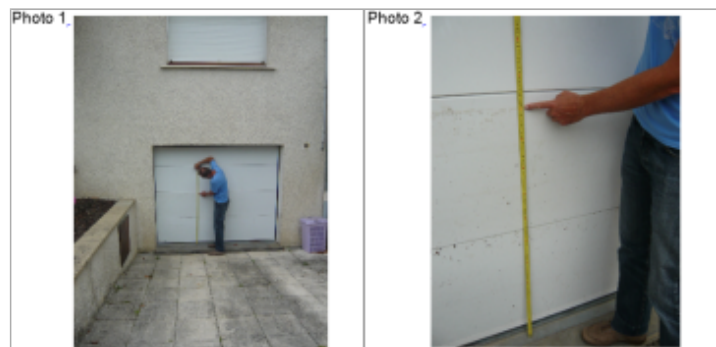
Trace du maximum de la crue sur la porte du garage au 10 rue du Chateau