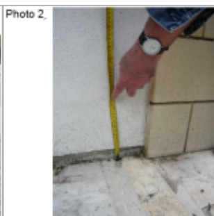
Trace du maximum de la crue sur le mur du portail